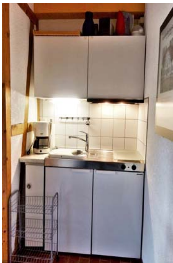
auf die Kochnische

eine Kochnische mit Kühlschrank, Ceranfeld mit 2 Kochfeldern, Dunstabzughaube, Toaster, Mikrowelle, Kaffeemaschine, Wasserkocher, Mixer etc., der Schlafbereich mit einem Bett (140x200) 2 Lattenrosten, verstellbar und 2 Matratzen, die Betten sind selbstverständlich bezogen, liegt eine Stufe ( ca. 17 cm ) höher als der Wohn-/Essbereich, ein schönes Duschbad mit feststehender Duschtrennung, WC und Föhn.