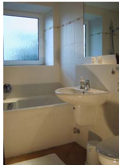
in das Badezimmer

Bettwäsche-, Hand- und Geschirrtücher, Strom, Wasser, Endreinigung inklusive.