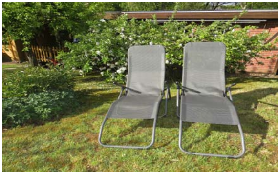
auf die Liegewiese