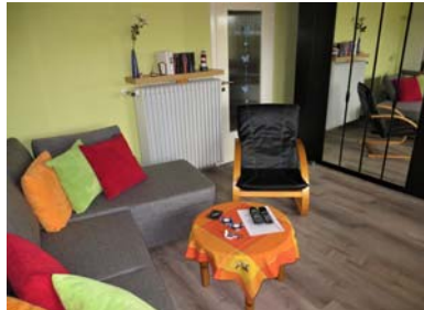
in den Wohn-/Schlafraum