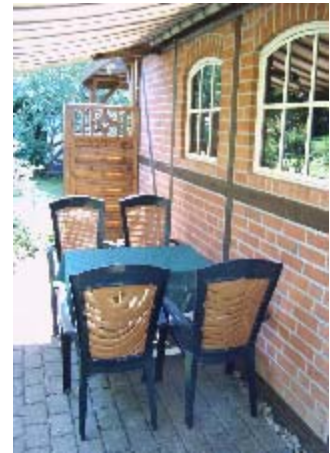
Blick auf die Terrasse hinter der Garage