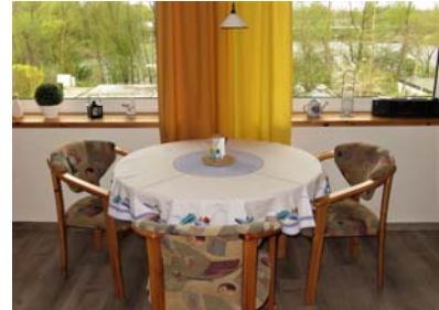
in den Essbereich

eine Küchenzeile mit Kühlschrank, Ceranfeld mit 2 Kochfeldern, Dunstabzughaube, Toaster, Mikrowelle, Kaffeemaschine, Wasserkocher, Mixer etc., ein Wannenbad mit Duschecke in der Wanne ( ebener Boden und Duschtrennung aus Glas ), WC und Föhn.