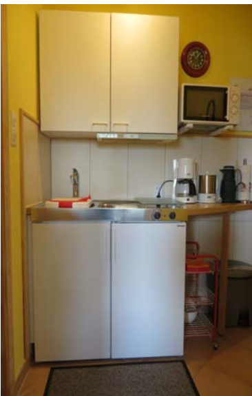
Blick auf die Küchenzeile

eine Küchenzeile mit Kühlschrank, Ceranfeld mit 2 Kochfeldern, Dunstabzughaube, Toaster, Mikrowelle, Kaffeemaschine, Wasserkocher, Mixer etc., ein Wannenbad mit Duschecke in der Wanne ( ebener Boden und Duschtrennung aus Glas ), WC und Föhn.