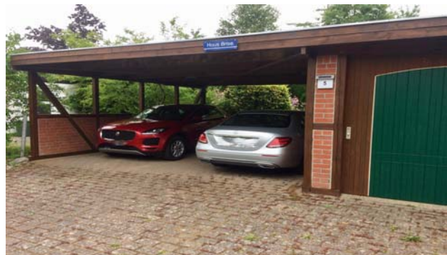
auf die Stellplätze

Ein Kinderreisebett und ein Hochstuhl stehen zur kostenlosen Benutzung zur Verfügung.