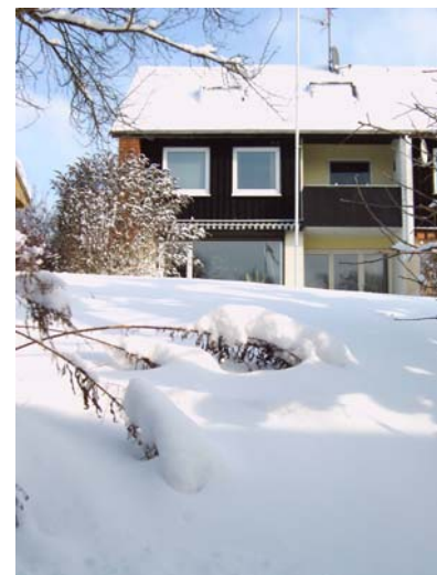
vom Kleinen Plöner See