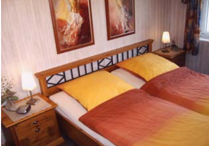
Blick in das Schlafzimmer

befindet sich im Hochparterre und verfügt über einen Schlafraum mit Doppelbett ( verstellbare Lattenroste ), die Betten sind selbstverständlich bezogen, einen Wohnschlafraum mit Schlafcouch bis zu 2 Personen, Balkon, Essecke, SAT-TV, Stereo-Radiorecorder, Internet-Anschluss, DVD-Player,