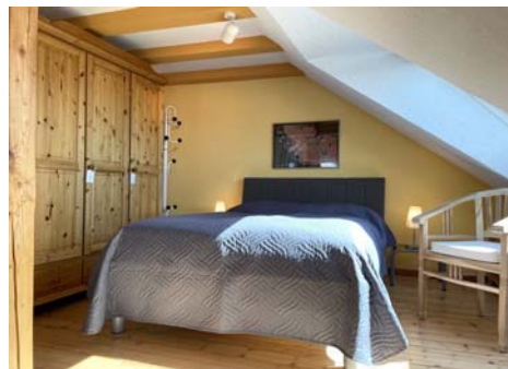
in den Schlafbereich