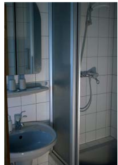
in das Duschbad

Bettwäsche-, Hand- und Geschirrtücher, Endreinigung inklusive.