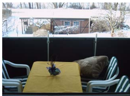
auf den Balkon