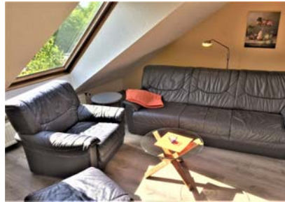
Blick in den Wohn-